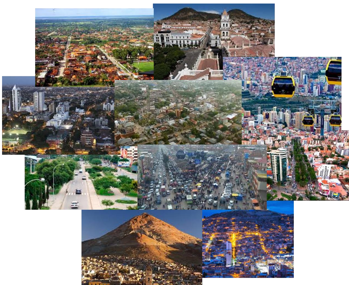
Ciudades de Bolivia